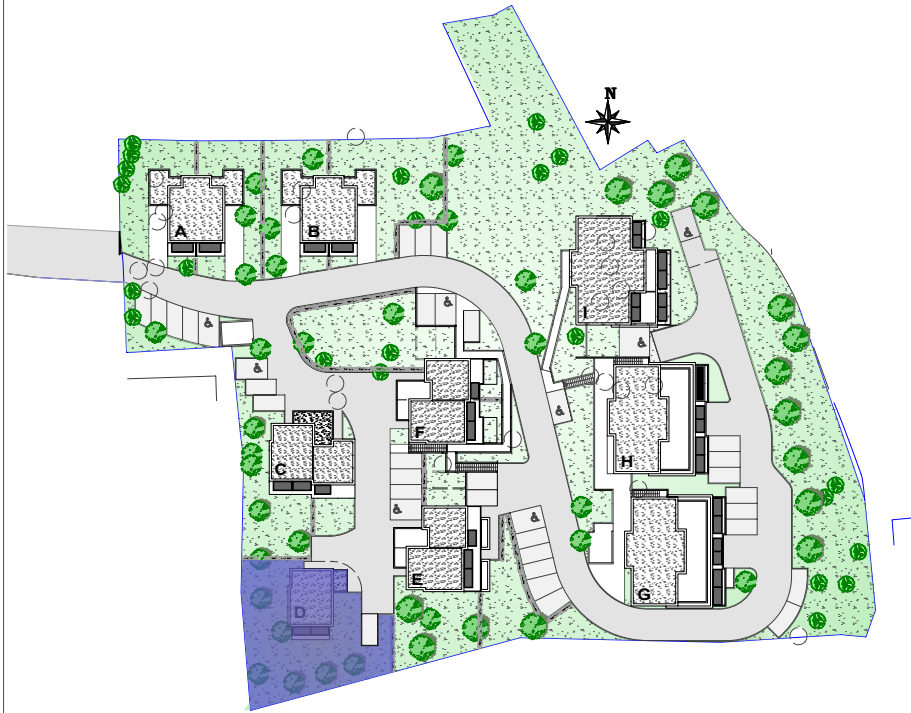
PLAN DE MASSE. Ech.1200e

GERARD GROSPIRON ARCHITECTE EPFL 19 Rue du Vieux Sextier 84000 AVIGNON tel: 04 9082 92 35 archi.grospron@gmail.com